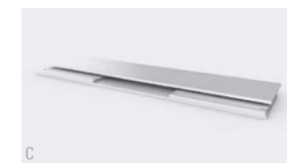
Einteilig und vormontiert