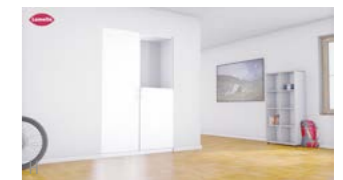
Einfach, schnell und stabil