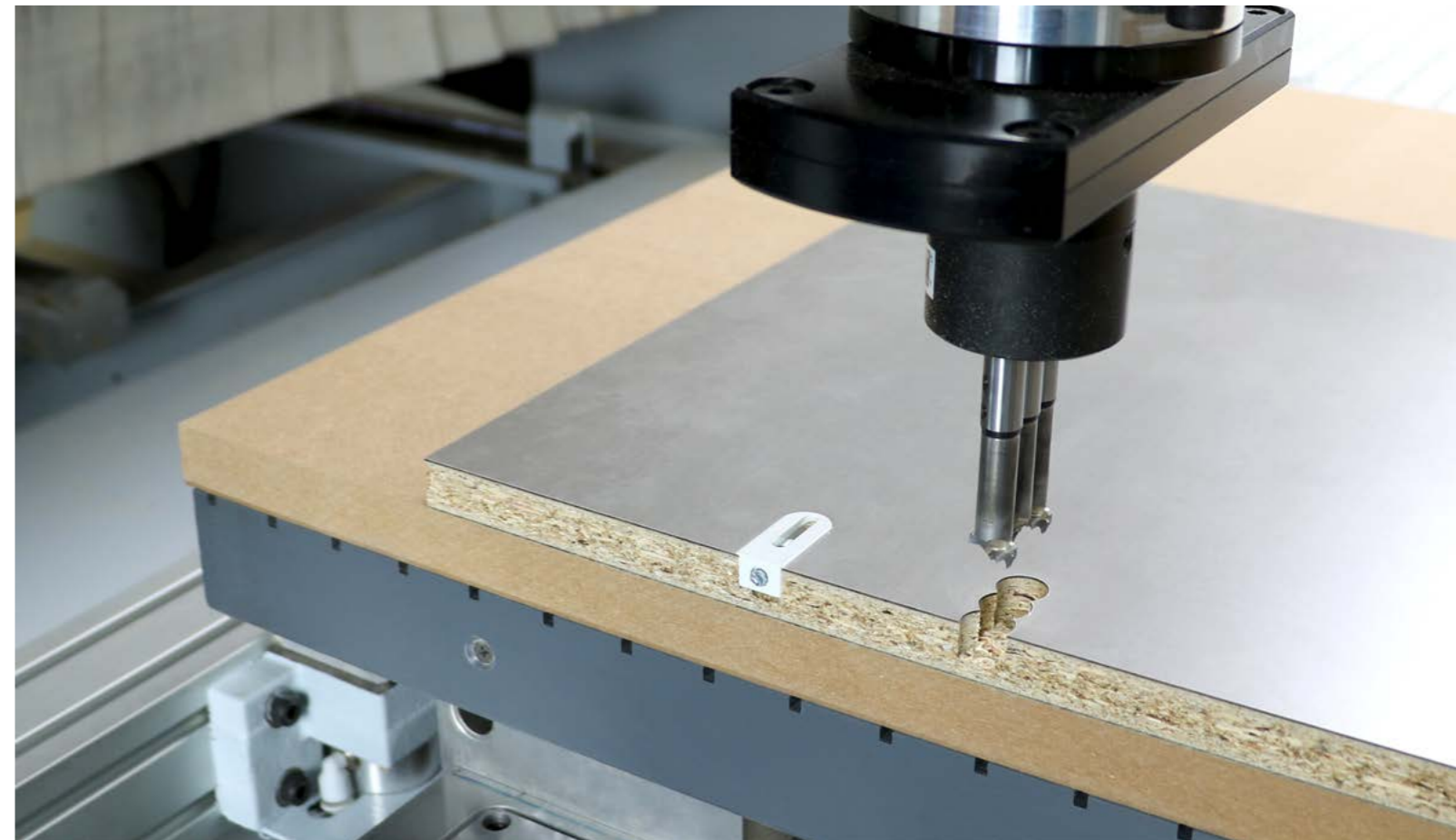
Die Verbindertaschen werden mit dem Mehrspindelkopf in einem Arbeitsschritt eingebracht.