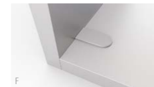
Paneelen ab 12 mm Dicke